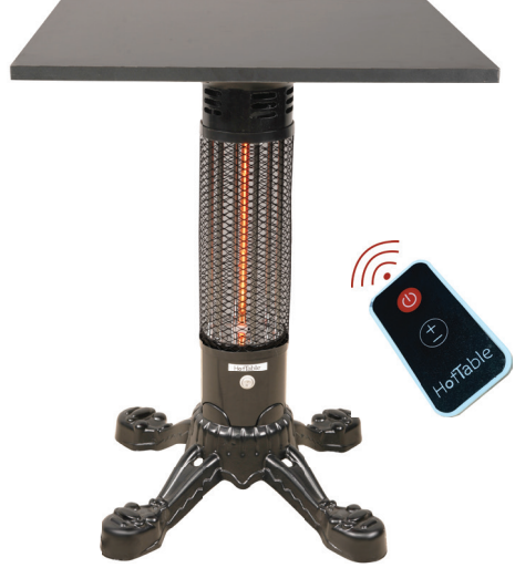
Hortable Tekno1500 Plus Hortable Tekno2000 Plus